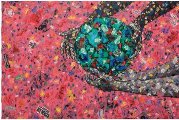
'Wat is ons heilig?' 2023 Emeka Udemba