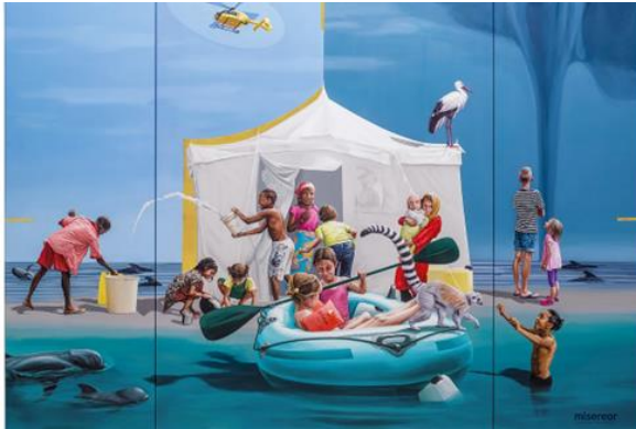
'Samen dromen' 2025 Konstanze Trommer

Op twee bijeenkomsten staan we stil bij resp. het hongerdoek uit 2019 en 2025. Wellicht dat we volgend jaar de andere twee doeken als uitgangspunt zullen nemen. We kijken dan in stilte naar het doek, luisteren naar muziek/een filmpje en praten met elkaar over wat het betreffende hongerdoek ons te zeggen heeft en/of te doen geeft.