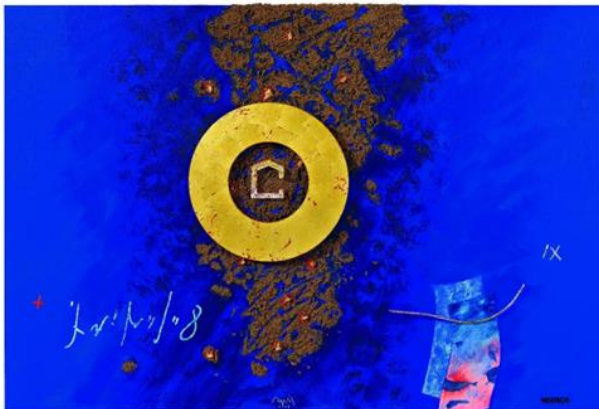
'Mens, waar ben je?' 2019 Uwe Appold